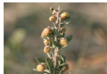
Waldsteppen-Beifuß ( Artemisia pancicii )