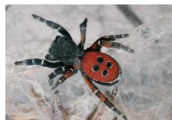
Schwarze Röhrenspinne ( Eresus kollari )