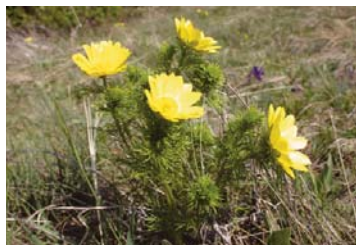
Frühlings-Adonis ( Adonis vernalis )

Weitere Informationen: www.life-bisamberg.at