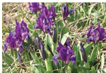
Zwerg-Schwertlilie ( Iris pumila )