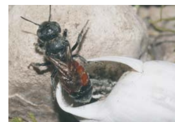
Mauerbiene ( Osmia andrenoides )