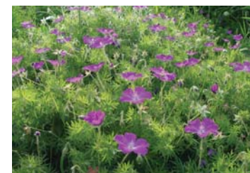
Blut-Storchschnabel ( Geranium sanguineum )