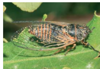
Hühnerzikade ( Cicadetta tibialis )