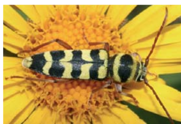
Bockkäfer ( Plagionotus floralis )