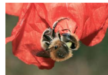
Mohnbiene ( Osmia papaveris )