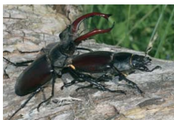
Hirschkäfer ( Lucanus cervus )