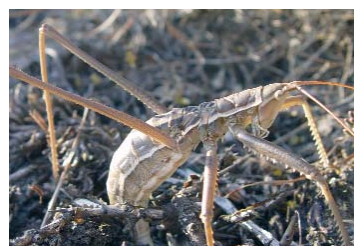
Sägeschrecke ( Saga pedo )