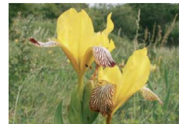
Bunte Schwertlilie ( Iris variegata )