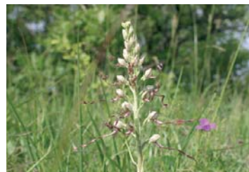
Riemenzunge ( Himantoglossum adriaticum )