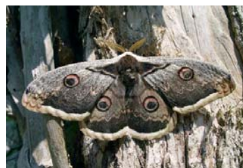
Wiener Nachtpfauenaug ( Saturnia pyri )