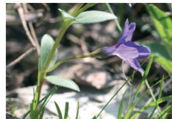
Bisamberg-Immergrün ( Vinca herbacea )