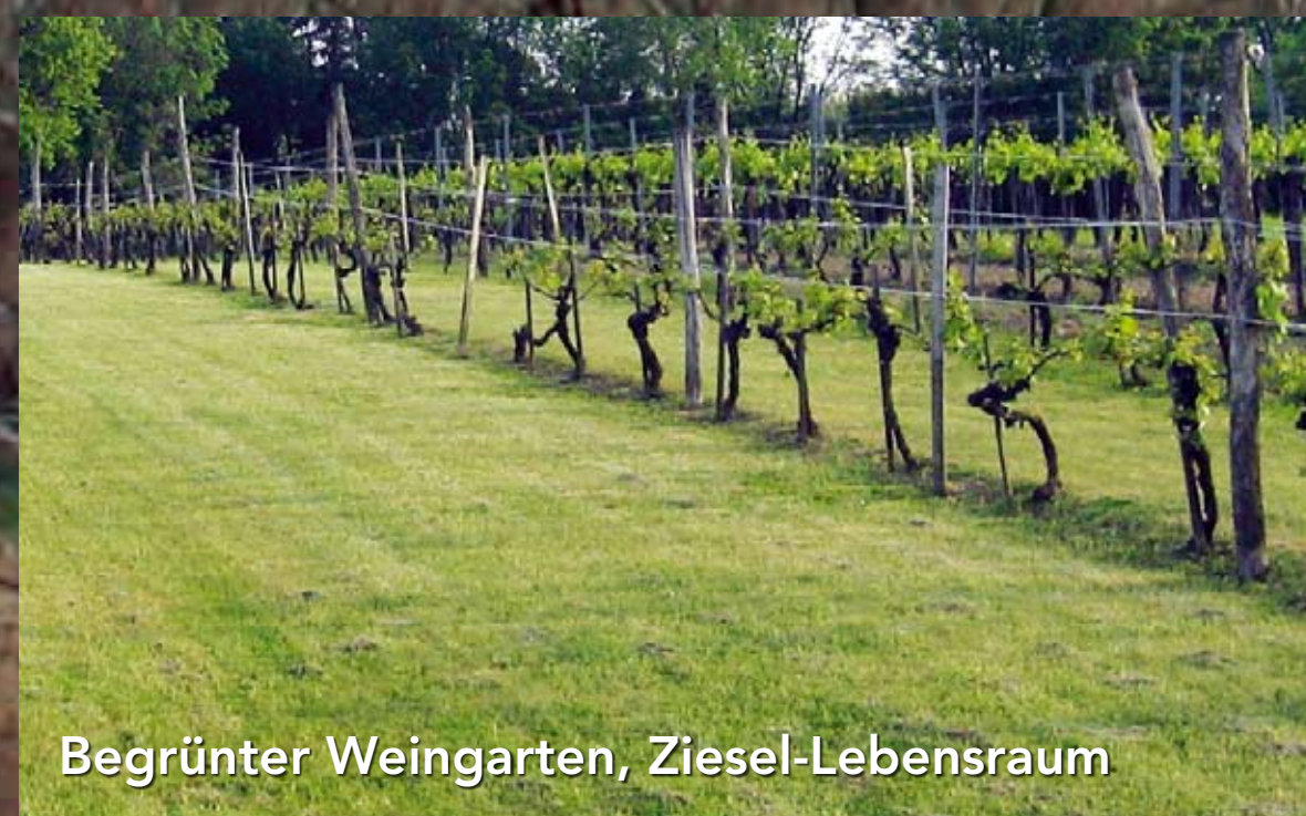
Begrünter Weingarten, Ziesel-Lebensraum