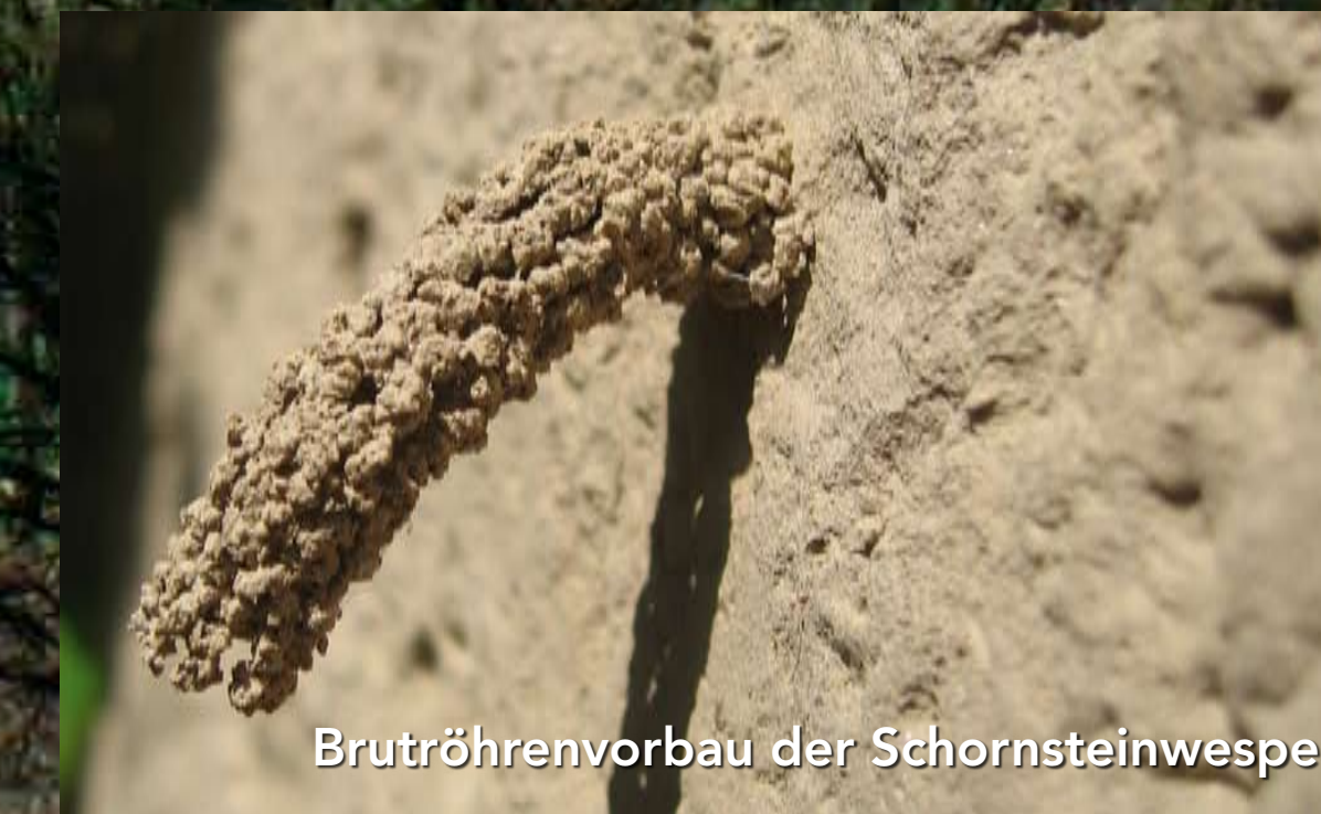
Bruttröhrenvorbau der Schornsteinwespe