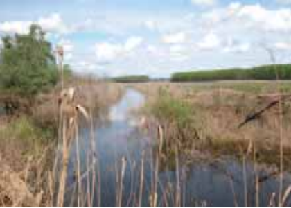
Foto oben: Nebengewässer der Theiß Foto Mitte: Ungarisches Graurind Foto unten: Seekanne