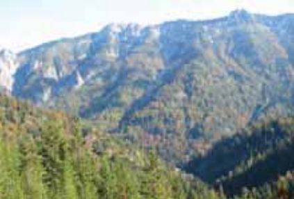
Foto oben: typischer Lebensraum Foto Mitte: Braunbär Foto unten: Spurensuche