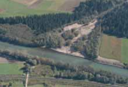
Foto oben: Erhöhung des Geschiebeeintrages Foto Mitte: Flussbettstruktur (Aufweitung Kleblach) Foto unten: Augewässer auf ehemaliger Ackerfläche